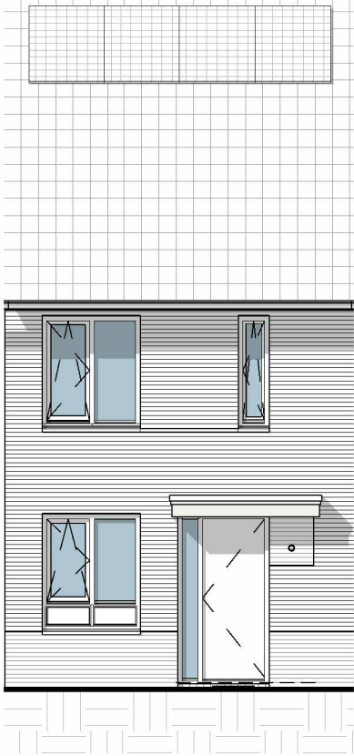
| G2s Voorgevel

aantal panelen conform BENG rapportage; afhankelijk van optie keuze